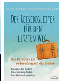
„Der Reisebegleiter für den letzten Weg“