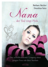
„Nana ... Der Tod trägt Pink“

Diese Bücher mit Nanas Geschichte sind bei IRISIANA/Randomhouse erschienen und können auch über den Verein erworben werden.