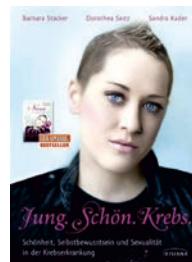
„Jung. Schön. Krebs.“